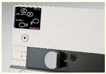
Papieranlage mit Sensor, der den Stanzvorgang auslöst