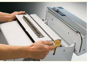
Schneller und problemloser Werkzeugwechsel in 1-2 Minuten