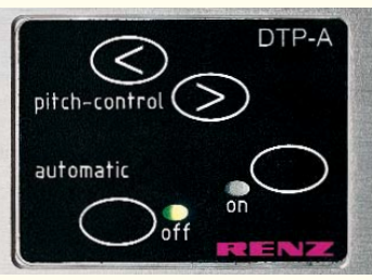
Übersichtliches Bedienfeld zur Einstellung aller Parameter