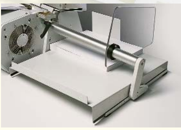
Papierablage für perforierte Blätter

HALBAUTOMATISCHES STANZEN Durch die von Renz entwickelte Teilautomatisierung wurde eine völlig neue Maschinenklasse geschaffen. Damit ist es erstmals gelungen, den Anwendern ein Maschinensystem anzubieten, die hohen Bedienkomfort, Schnelligkeit, Flexibilität und Wirtschaftlichkeit erwarten.