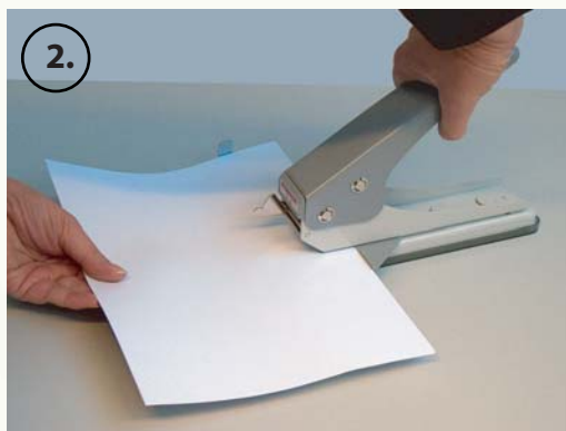
2. Papier einlegen und stanzen (max. 20 Bl. 70 / 80 gr./qm)