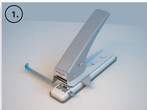
1. Seitenanschlag auf Papierformat einstellen