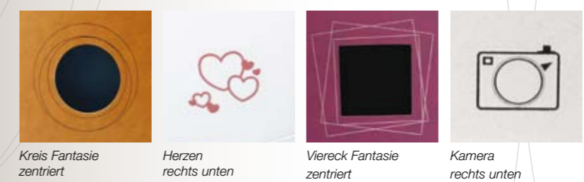
Kreis Fantasie zentriert Herzen rechts unten Viereck Fantasie zentriert Kamera rechts unten

Ein Warmfoliendruck ist erhältlich in Silber, Rot und Schwarz