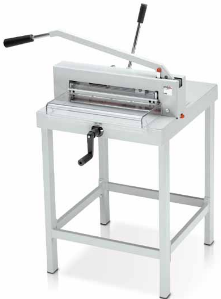
IDEAL 4305 mit optionalem Untergestell