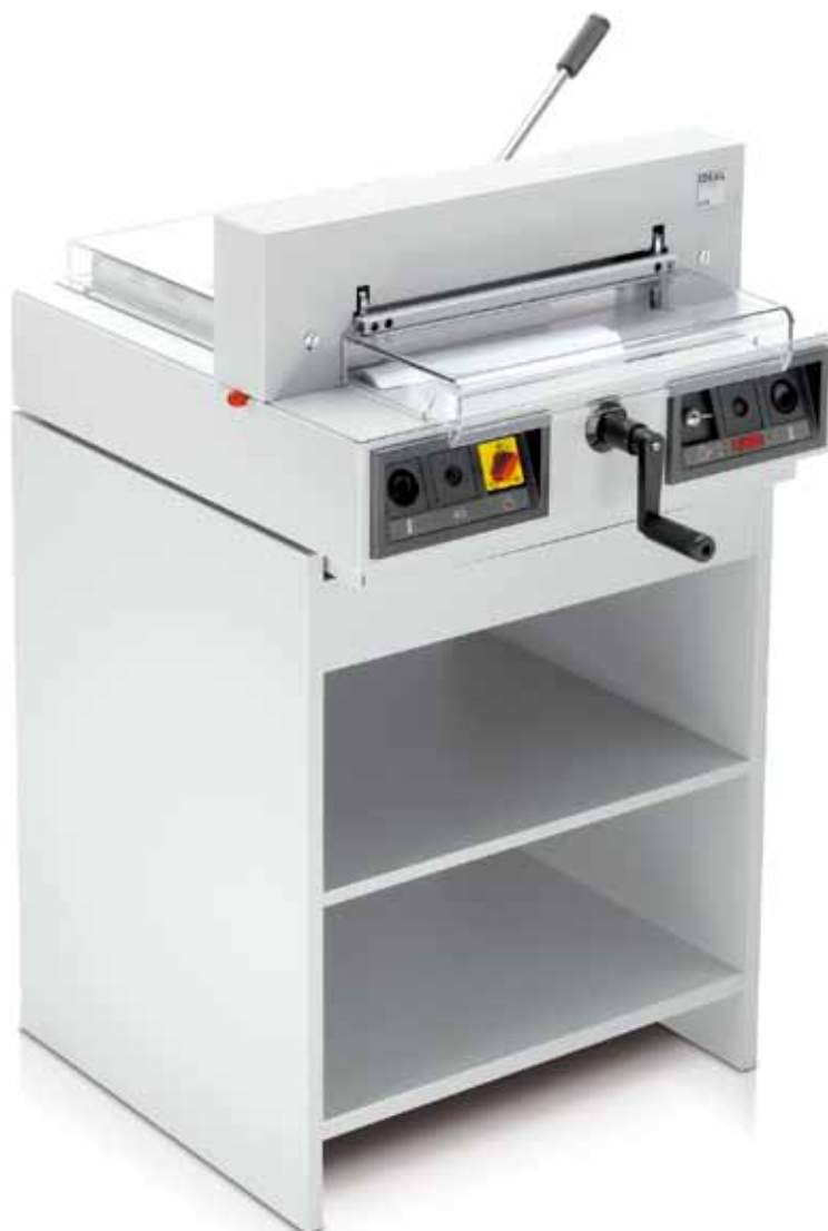
IDEAL 4315 mit optionalem Unterschrank