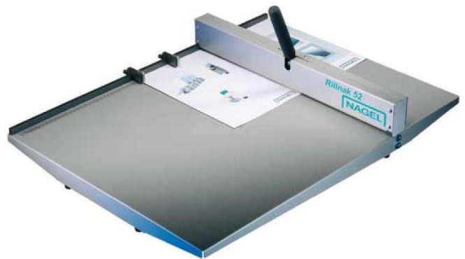
Nagel Rillnak 52

Der Nagel Rillnak 52 eignet sich bestens für die manuelle Rillung von Digital - drucken im 52 cm-Profformat und der Rillnak 35 für Digitaldrucke bis zum A3 Überformat. Papier bis 400 g / m 2 kann mit den Geräten mühelos verarbeitet werden.