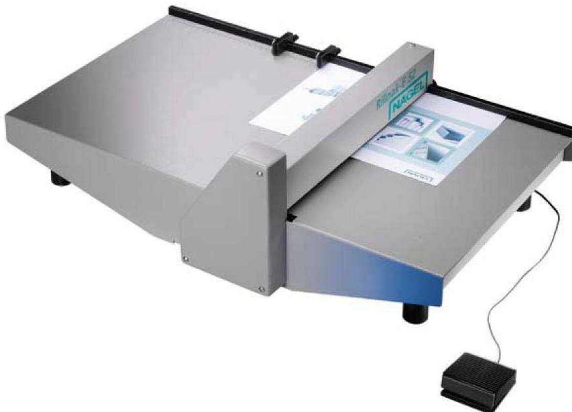
Rillnak-E 36 / -E 52 mit Fußauslöser