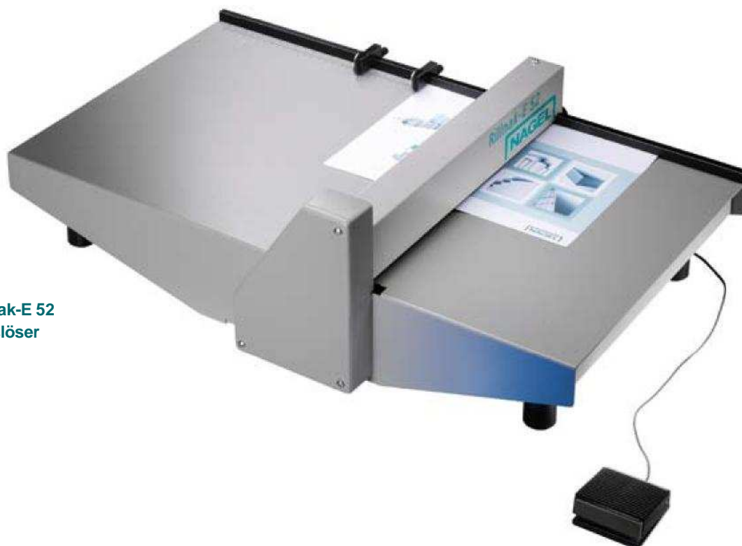
Nagel Rillnak-E 52 mit Fußauslöser

Der Rillnak-E 52 eignet sich bestens für die Rillung von Digitaldrucken im 52-cm-Profformat und der Rillnak-E 36 für Digitaldrucke bis zum A3 Überformat.