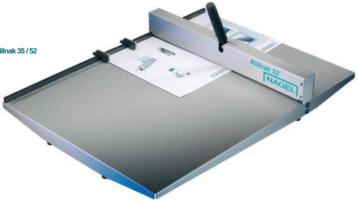
Rillnak 35 / 52

Handrillmaschinen & Elektrorillmaschinen