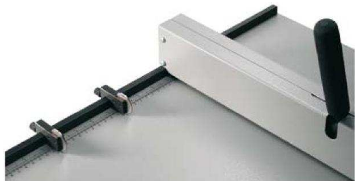
Skala und Anschläge des Rillnak 52

Durch die stabile Ausführung ist der Rillvorgang angenehm leichtgängig und dank der leicht lesbaren Skala sehr bedienerfreundlich. Die zwei serienmäßigen Anschläge ermöglichen Mehrfachrillungen, so sind auch ganz individuelle Aufträge möglich. Zusätzliche Anschläge können jederzeit ergänzt werden.